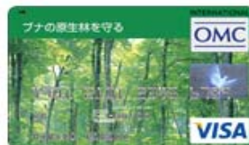
ブナの原生林を守る （Visa）