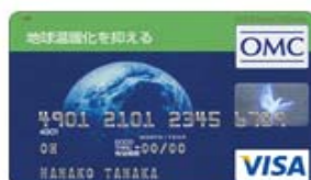
地球温暖化を抑える （Visa）