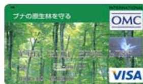
ブナの原生林を守る (Visa)