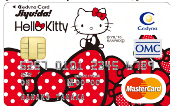
【セディナカードJiyu!da! ハローキティ】