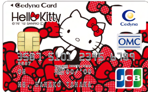
【セディナカードクラシック ハローキティ】