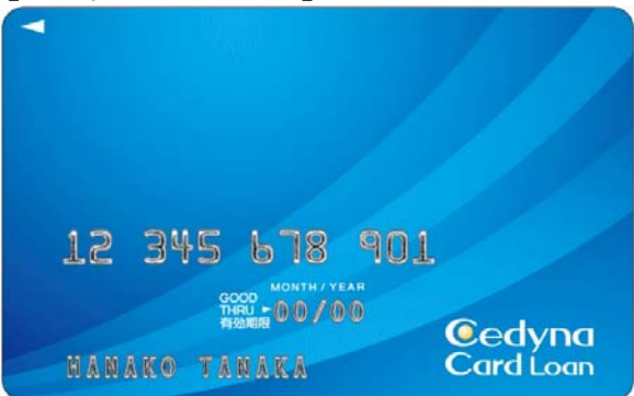
【セディナカードローン】