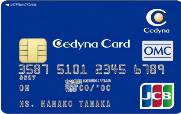
【セディナカードファースト】