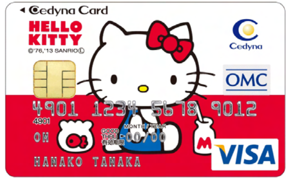
【セディナカードファースト ハローキティ】