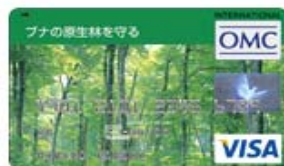
ブナの原生林を守る (Visa)