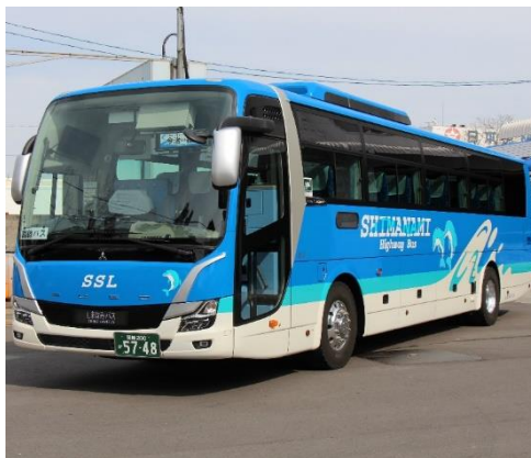
【しまなみバスが運行する高速乗合バス】

(※) タッチ決済対応のカード（クレジットカード、デビット、プリペイド）や、カードが設定されたスマートフォン等