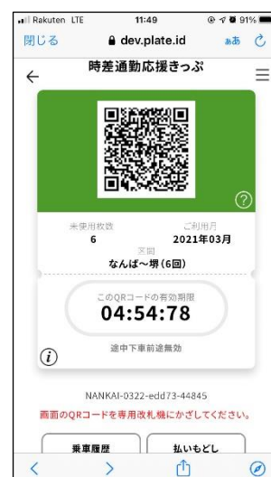
入場する際の画面