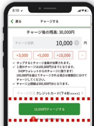
◀「HOP マネーへのチャージ画面」▶