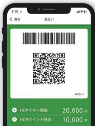
◀「HOP WALLET お支払い画面」▶