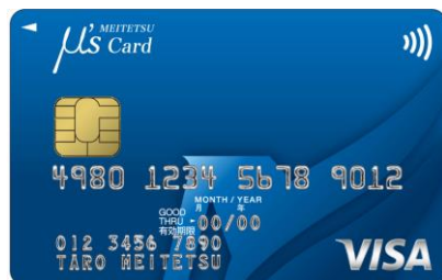
【名鉄ミュージックカード】