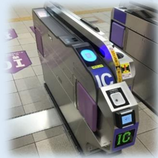
一体型改札機 (泉北高速鉄道)