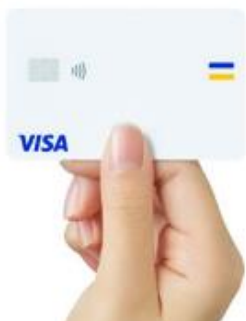
▲タッチ決済可能なVisaカード