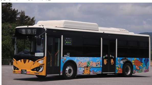
(世界自然遺産ラッピングバス)

西表島交通が運行する路線バスは、世界自然遺産に登録されている西表島の北西部の白浜と東南部の豊原の間を結ぶ路線バスで日本最南端を運行しています。西表島は年間約 30 万人の観光客が来訪する島であり、今般、西表島交通の路線バスが国際ブランドのタッチ決済に対応することにより、カードやスマートフォン等を読み取端末にかざすだけでバスに乗車可能となるため、観光客や地元のお客さまの利便性向上が図られます。