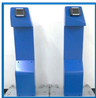
(ポール型専用端末)