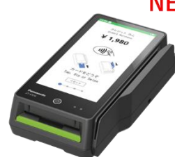
stera terminal unit