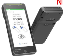
stera terminal mobile