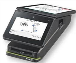
stera terminal standard

オールインワン端末「stera terminal」の機能を活かしつつ、事業者の業態に合わせた2種類のプロダクトをラインアップに追加します。これまでの「stera terminal」を「stera terminal standard」と位置づけ、「stera terminal mobile」と「stera terminal unit」をリリースいたします。