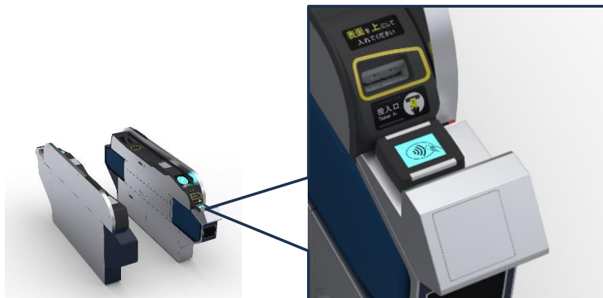
【自動改札機のイメージ】

実証実験の開始にあたり、札幌市営地下鉄全46駅の一部自動改札機にタッチ決済読取部を搭載します。