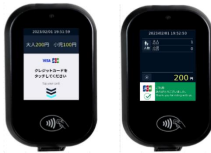
<専用リーダー（イメージ）>

お手持ちのタッチ決済対応のカード（クレジット・デビット・プリペイド）や、同カードが設定されたスマートフォン等を、専用リーダーにタッチすることで、そのまま乗車（降車）いただけます。