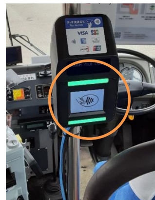
運転席後部のリーダー