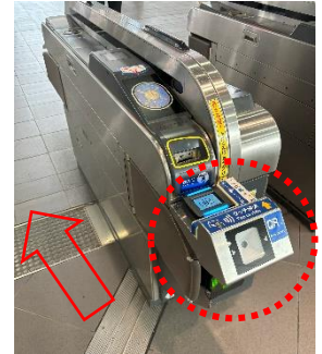
（出場時に対応改札機にタッチ）