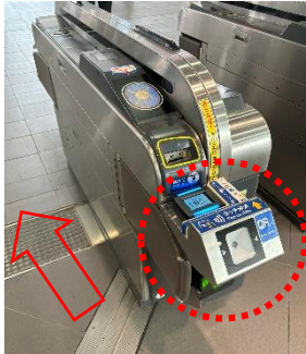
（入場時に対応改札機にタッチ）