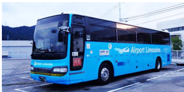
【とさでん交通が運行する高知龍馬空港連絡バス】