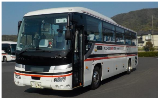
【松江一畑交通が運行する空港連絡バス】