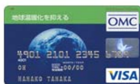
地球温暖化を抑える (Visa)