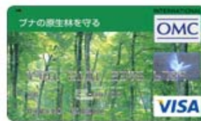
ブナの原生林を守る (Visa)