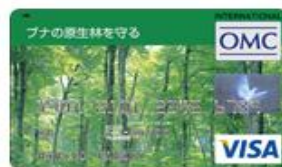
ブナの原生林を守る (Visa)