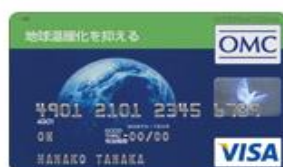
地球温暖化を抑える (Visa)