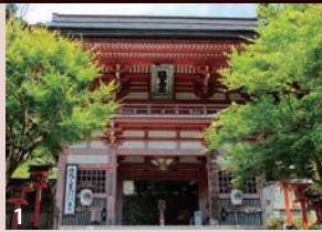
1 少年期の源義経(牛若丸)が天狗とともに修行したと伝わる鞍馬寺。境内の霊宝殿では多数の寺宝を展示。 2 天皇家ゆかりの宝物を多数収蔵する実相院門跡。板の間の床に映り込む「床みどり」が夏の訪れを告げる。

●お申し込み受付は先着順となります。【4/22(水) 10:00電話受付開始】 電話・専用WEBサイトでの仮予約後、詳しい旅行条件と内容を説明した書面をお送りいたします。