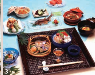
3 「京料理 下鴨福助」では、季節の会席料理を堪能後、屋上で送り火を観賞(「鳥居形」除く)。4 貴船川のせせらぎに涼を感じながら、名物の川床料理が味わえる料理旅館「貴船ふじや」。

鎮魂と平和を願って、毎年8月16日に行われる伝統行事「京都五山送り火」。東山如意ヶ嶽の「大文字」を皮切りに「妙・法」「船形」「左大文字」「鳥居形」の5つの送り火が、去りゆく古都の夏の夜空を彩ります。 今回は特別企画として、「京料理 下鴨福助」(「鳥居形」を除く4山観賞可)と「中国料理 桃園亭」(全5山観賞可)の2つの絶景スポットをご用意。通常非開放の屋上からゆつたりと送り火をご覧いただけます。